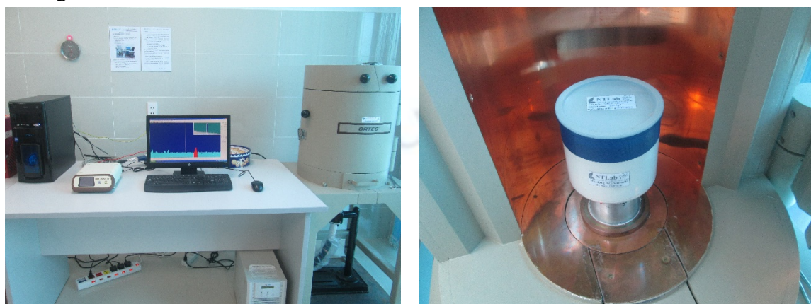
Hình 1. Hệ phổ kế gamma HPGe GMX35P4 – 70 và hình học mẫu Marinelli

Nghiên cứu sử dụng hệ phổ kế gamma thuộc Phòng Thí nghiệm Kỹ thuật Hạt nhân, Trường Đại học Khoa học Tự nhiên Thành phố Hồ Chí Minh (Hình 1). Mẫu chuẩn và mẫu phân tích được đóng trong hộp dạng Marinelli, với cùng chiều cao mẫu là 8,4 cm và được đo cùng điều kiện như nhau.