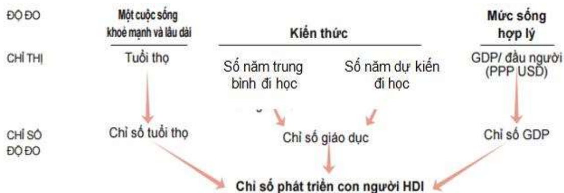
Hình 1. Các chỉ báo của HDI [11]

HDI (Chỉ số phát triển con người) là một trong ba chỉ số (chỉ số phát triển con người (HDI), chỉ số phát triển giới tính (GDI) và chỉ số nghèo khổ con người (HPI)) để đo lường sự tiến bộ trong phát triển theo cách không chỉ dựa vào tăng trưởng thu nhập hay GDP [11]. HDI là thước đo tổng hợp về sự phát triển kinh tế xã hội của một quốc gia hay vùng lãnh thổ trên các phương diện thu nhập (thể hiện qua thu nhập quốc dân bình quân đầu người điều chỉnh ngang giá sức mua tương đương theo đô la Mỹ PPP_USD); tri thức (thể hiện qua chỉ số học vấn chi tiết hơn là số năm trung bình đi học và số năm dự kiến đi học) và sức khỏe (thể hiện qua tuổi thọ bình quân tính từ lúc sinh) của con người (Hình 1). Cách tính toán HDI được chi tiết cụ thể tại [11] và có giá trị nằm trong khoảng từ 0 đến 1. HDI đạt tối đa bằng 1 thể hiện trình độ phát triển con người cao nhất; HDI tối thiểu bằng 0 thể hiện xã hội không có sự phát triển mang tính nhân văn.