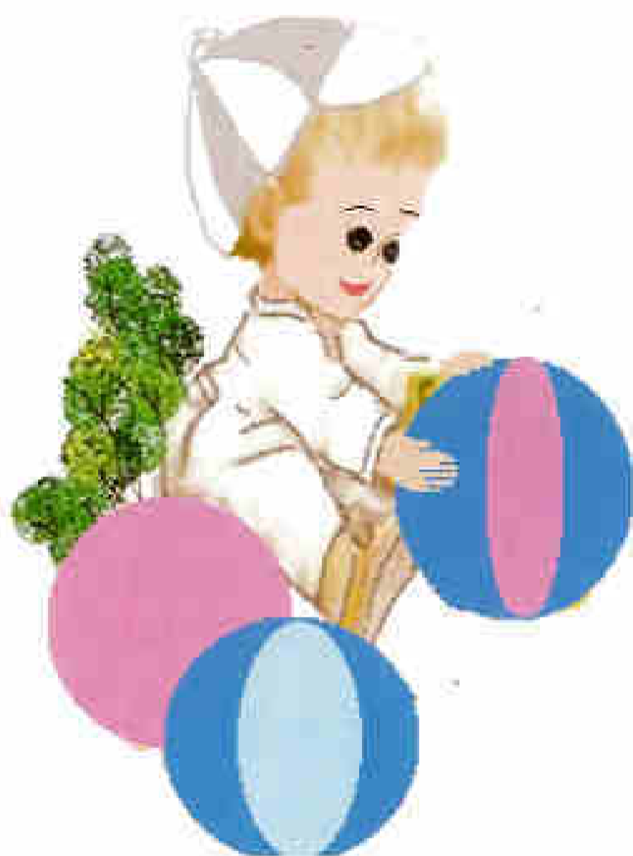
H1. HĐVĐV là quá trình trẻ tiếp xúc với đồ chơi, đồ vật...

[10]. HĐVĐV diễn ra khi trẻ tương tác tích cực với đồ chơi, đồ vật mà chúng có dịp tiếp xúc, bằng những khả năng cảm giác và vận động của bản thân.