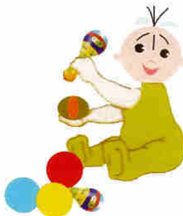
H2. Chơi với đồ chơi là hoạt động với đồ vật

Hành động chơi với đồ vật, đồ chơi xuất hiện rất sớm. Những hành động vồ lấy, cầm nắm, lắc, gõ, đập, ngậm, quăng ném đồ chơi, đồ vật có ngay từ khi trẻ nằm trong nôi; những hành động chơi tương đối có mục đích kể từ 8 – 9 tháng